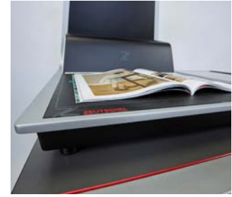
■ Einfachste Inbetriebnahme dank Plug'n'Scan