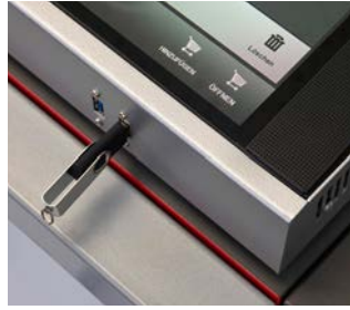
■ Flexible Schnittstellen