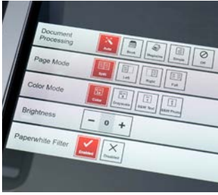
■ Touchpanel (21,5") mit Multi-Touch-Technologie