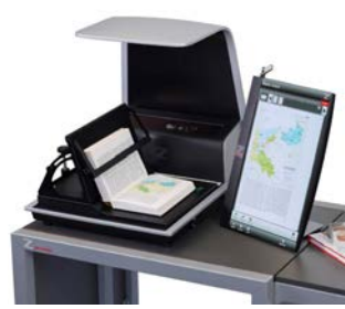
■ Version OS 15000 Comfort mit Touchpanel und zeta Software