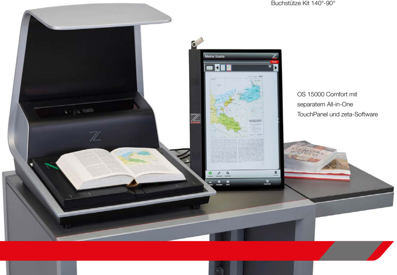
OS 15000 Comfort mit separatem All-in-One TouchPanel und zeta-Software